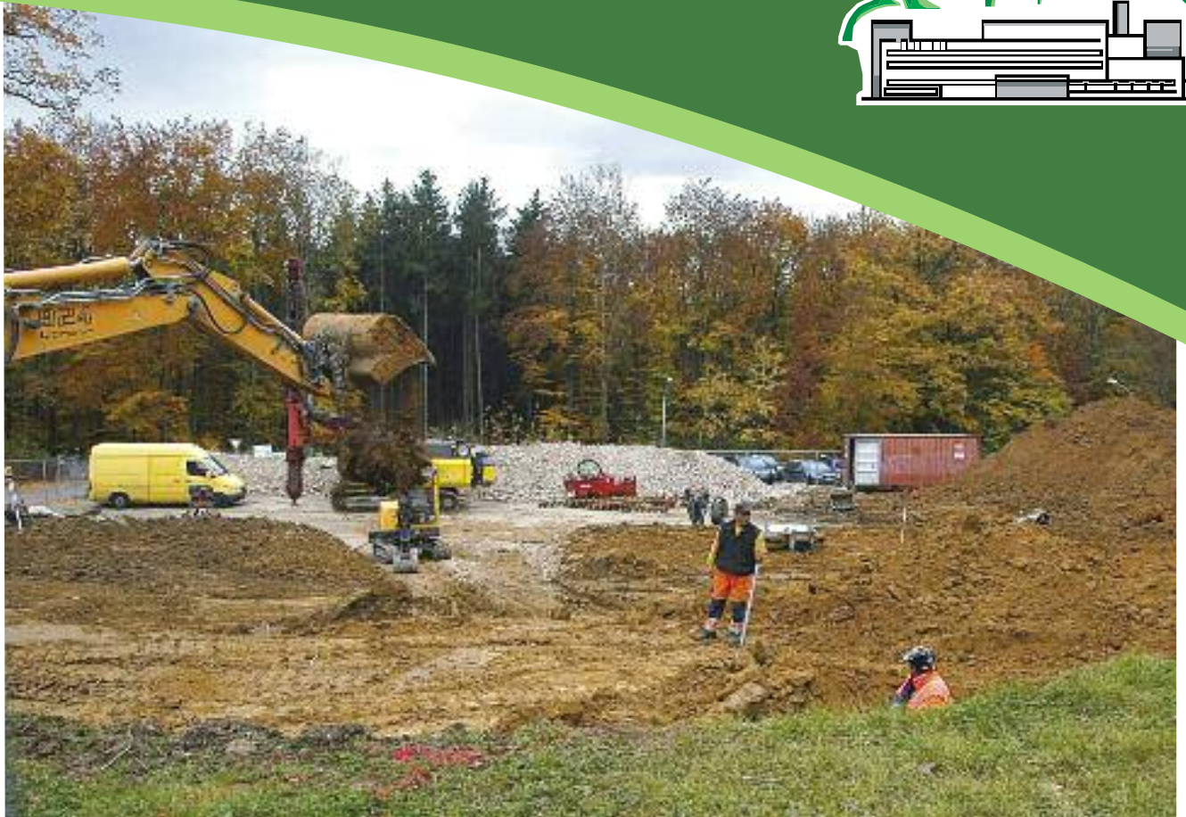
Die Bauarbeiten am Facharztzentrum neben dem Kreiskrankenhaus sind in vollem Gange (Seiten 4 und 5).

Wo finde ich was im Krankenhaus? Seite 16