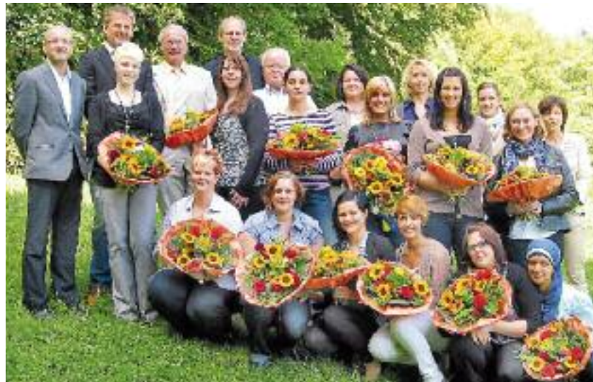
Absolventinnen der Krankenpflegeschule in Weilburg zusammen mit ihren Lehrern und Prüfern.

Ein klares Zeichen, dass sich die Situation auf dem Arbeitsmarkt für qualifizierte Pflegekräfte deutlich anspannt. Nie zuvor wurden so viele freie Stellen für die frisch examinierten Gesundheits- und Krankenpflegerinnen angeboten. Die Weilburger Klinik bevorzugt bei der Auswahl von Bewerbern für